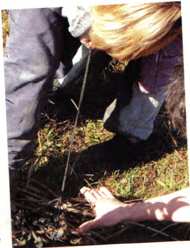
Nous réalisons des fagots.

C'est aussi l'un des rares établissements publics qui propose une démarche pédagogique à la fois alternative et